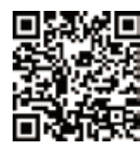
アプリダウンロードQR