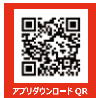
アプリダウンロードQR